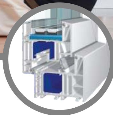
bluEvolution: 82 AD