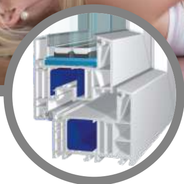
bluEvolution: 82 MD